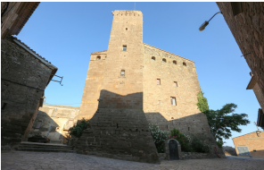
Castell de l'Aranyó