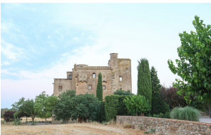
Castell de Ratera