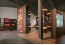
Centre d'Interpretació dels Castells del Sió