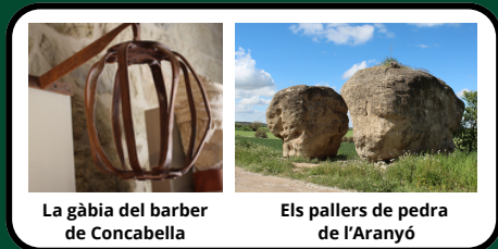
La gàbia del barber de Concabella