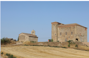
Castell de Montcortès