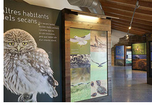
Centre d'Interpretació dels Secans de Lleida