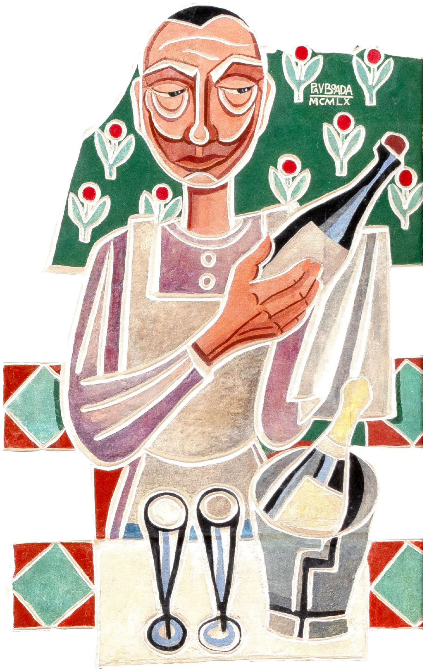
Mural de la vinya i el vi (fragment). Pau Boada, 1960. VINSEUM.

7 — 17.11 Penedès 27.11 — 1.12 Priorat 2024 mostfestival.cat